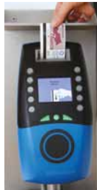
Il biglietto va obliterato ad ogni viaggio.

Info noleggio biciclette: www.bici-altoadige.com www.papin.it